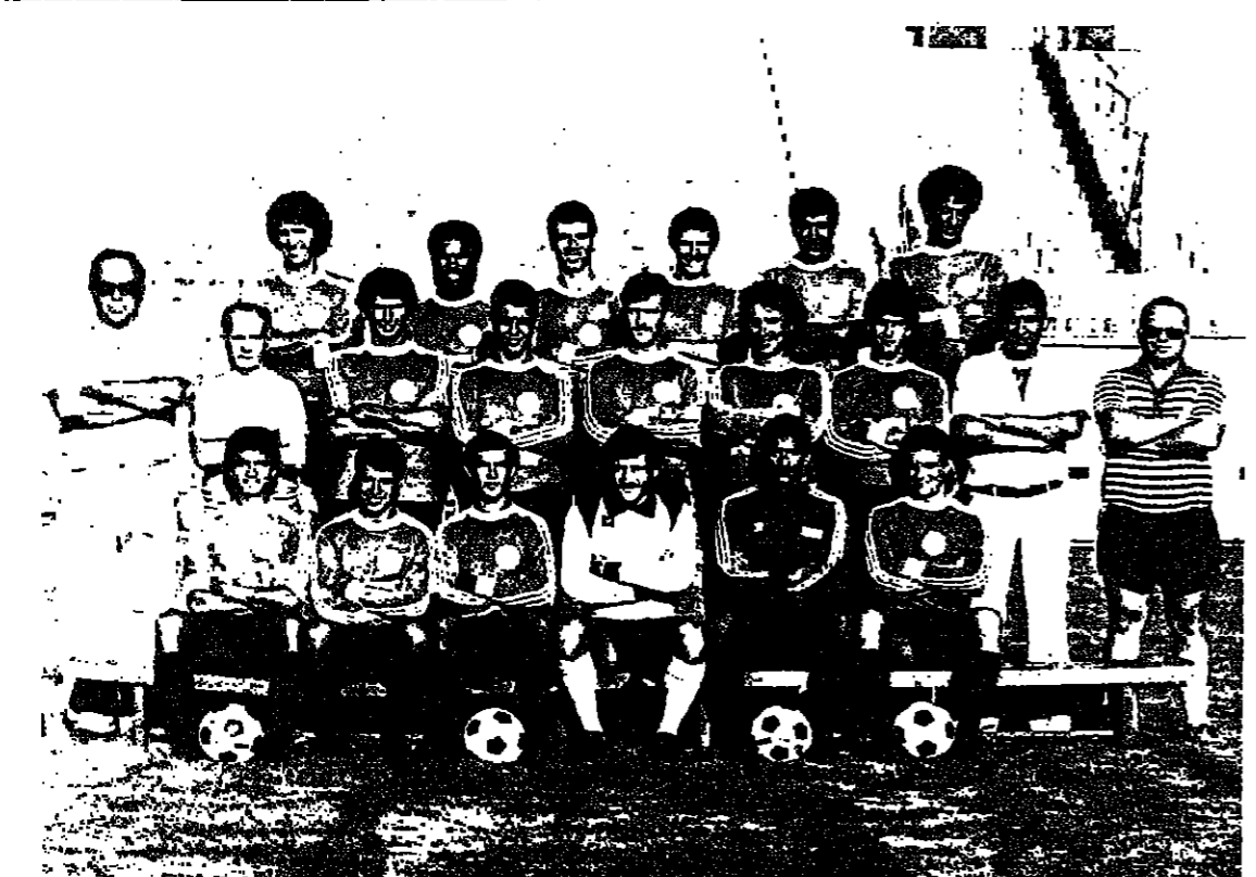
لقاء هوبويل تل ابيب المتربع على عرش الدوري الممتاز مع فريق هوبويل بنو نعيم ..